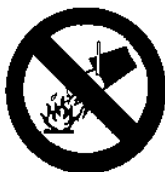
Divieto di spegnere con acqua