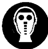
Protezione obbligatoria delle vie respiratorie