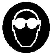
Protezione obbligatoria degli occhi