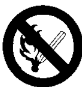
Vietato fumare o usare fiamme libere