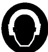
Protezione obbligatoria dell'udito