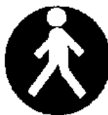
Passaggio obbligatorio per i pedoni