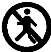
Vietato ai pedoni