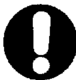
Obbligo generico (con eventuale cartello supplementare)