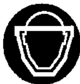
Protezione obbligatoria del viso