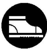
Calzature di sicurezza obbligatoria