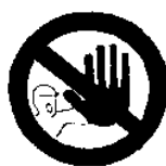
Divieto di accesso alle persone non autorizzate