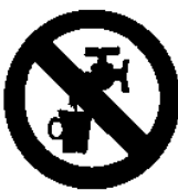
Acqua non potabile