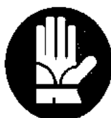
Guanti di protezione obbligatoria