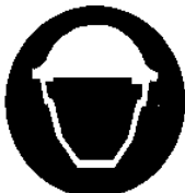
Casco di protezione obbligatoria