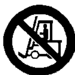
Vietato ai carrelli di movimentazione