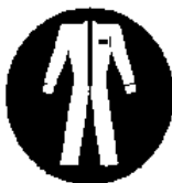
Protezione obbligatoria del corpo