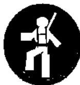
Protezione individuale obbligatoria contro le cadute